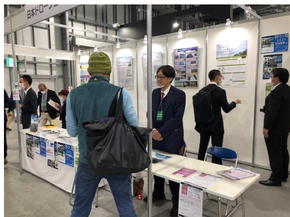
JDCブースでの熱心な意見交換

JDCのブースには新しい機体など目立つ展示がなかったにも関わらず、準備した1000部のパンフレットが初日には底をつき、急遽追加分を準備する盛況ぶりでした。また、来訪者とのやりとりでは、以前は多かったドローンそのものに関する質問ではなく、「新しい制度への対応」や「具体的な事業を展開」する上での相談などが増え、幅広い分野のメンバーで構成されるJDCに対する期待の大きさや、その方向性を知るうえで貴重な機会となりました。