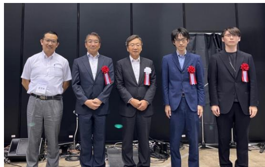
写真1 野波会長と受賞者