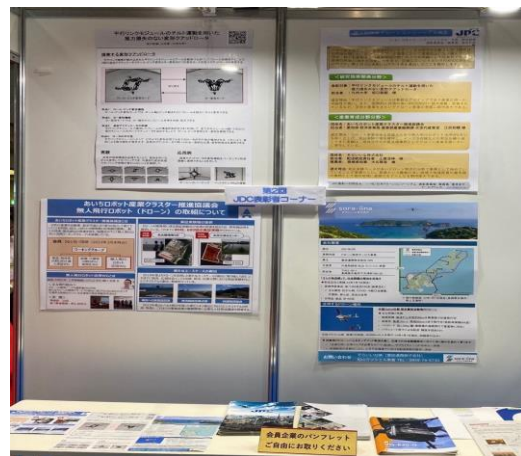
写真3 JDCブースでのポスター展示